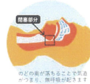
のどの奥が落ちることで気道がつまり、無呼吸が起きます