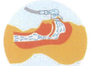
鼻マスクから空気を送り込み、気道を広げます